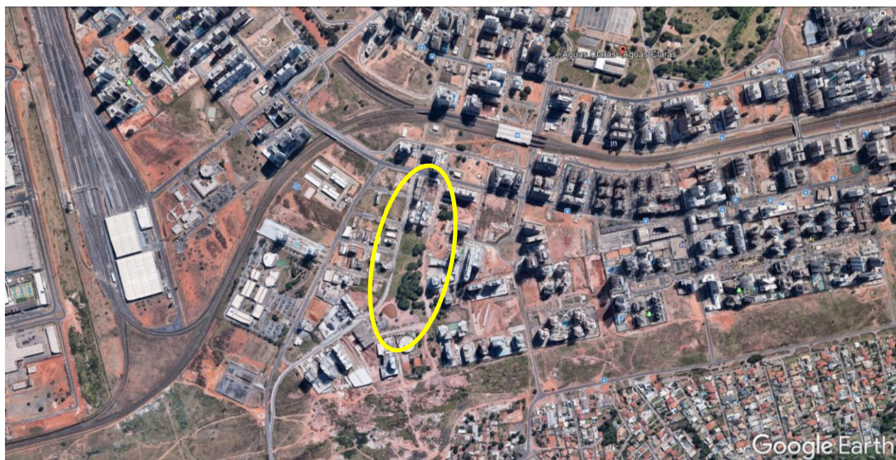
Fig. 02 – Região do Parque Sul – em Águas Claras.