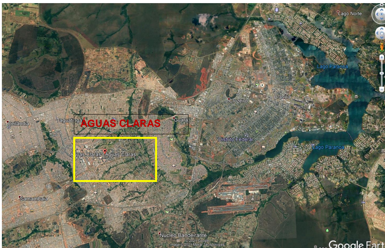
Fig. 01 – Localização da área – ÁGUAS CLARAS.