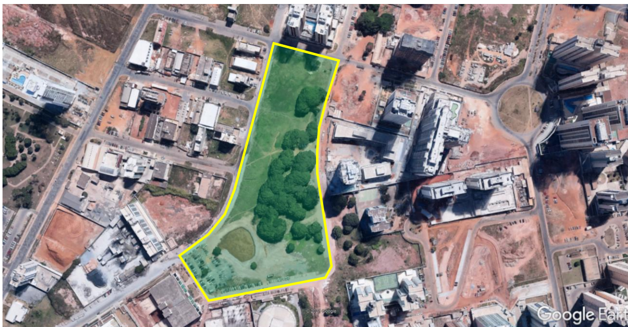
Fig. 03 – Área onde será implantado o Parque Sul – em Águas Claras.