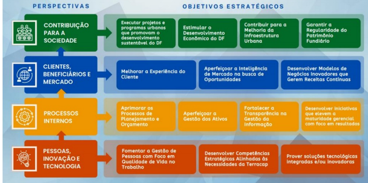
Figura - Mapa Estratégico da Terracap

Comportamento Ético / Compromisso com Resultados / Criatividade e Inovação / Respeito nas Relações Interpessoais / Responsabilidade Socioambiental / Satisfação dos Clientes / Transparência na Gestão.