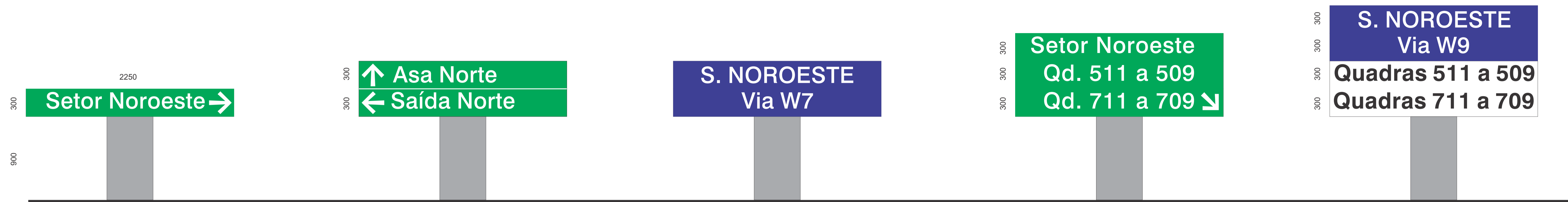
Peça: S1 - Direcional Escala 1:20