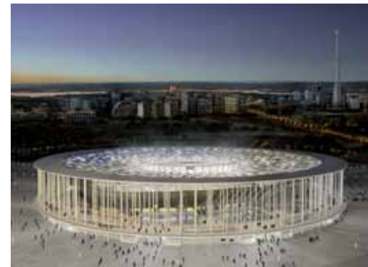
Estão na exposição imagens dos novos projetos da Terracap

As imagens expostas, acompanhadas por textos explicativos, estão distribuídas em quatro totens. Cada totem tem 1,6 metro de largura por 2 metros de altura, com base de metal e quatro placas de vidro, formando "pétalas". Completa a mostra uma maquete informatizada do Setor Noroeste e do Parque Burle Marx.