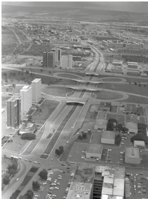
A mostra apresenta obras realizadas desde 1973

Exposição mostra as obras realizadas pelo GDF com os recursos obtidos com a venda de lotes da Companhia