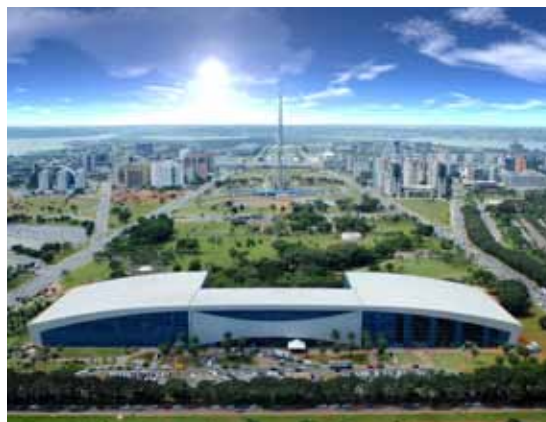
A exposição reúne 128 imagens de obras da Terracap

A exposição mostra também obras que estão sendo entregues nas comemorações dos 50 anos de Brasília. É o caso da nova Rodoviária Interestadual e do Complexo Cultural da Torre de Televisão. São ainda apresentadas imagens dos novos projetos, como a Torre de Televisão Digital, o Parque Tecnológico Capital Digital, a Via Interbairros e o Parque Capital Saúde.