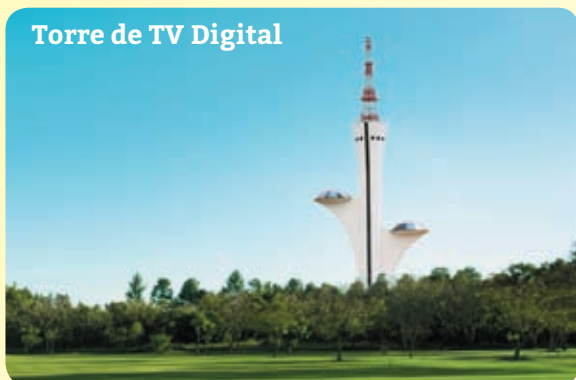
Torre de TV Digital