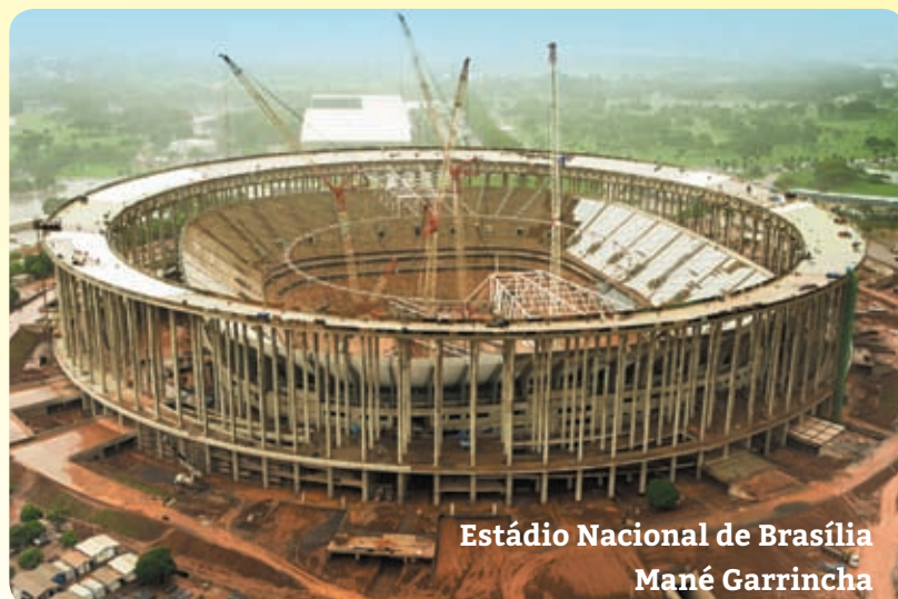
Estádio Nacional de Brasília Mané Garrincha