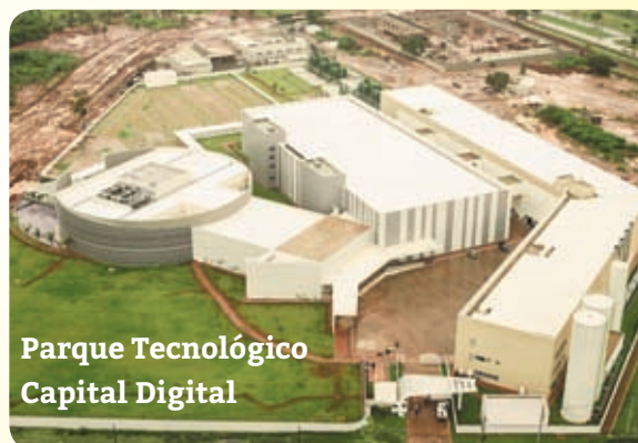
Parque Tecnológico Capital Digital

A Licitação começa às 9h com o recebimento das propostas no Auditório da TERRACAP, SAM Bloco F - atrás do anexo do Palácio do Buriti (61) 3342.2333 • 3342.2305 • 3342.1825