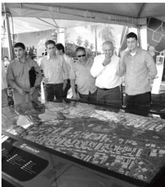
Crédito: Anofre Sena

Maquete do Setor Noroeste atraiu investidores durante a licitação.